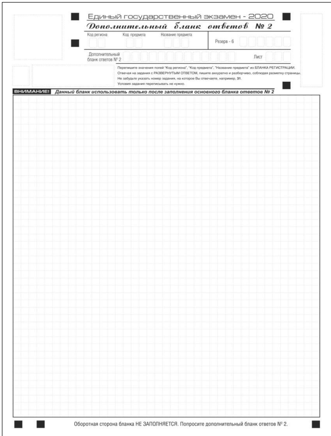
Рис. 15. Дополнительный бланк ответов № 2